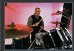
...a volte un Bill Ward è tutto ciò che viene richiesto