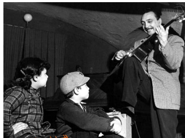
Django Reinhardt è uno dei grandi chitarristi jazz del XX secolo: mescolando la tradizione musicale tzigana con il jazz, crea il jazz manouche.

La chitarra è innanzitutto, insieme all'armonica, lo strumento dei cantanti blues. Ma nella grande orchestra di jazz il nostro strumento riesce a farsi sentire con difficoltà. Viene allora aggiunta alla sezione ritmica (ossia a quel gruppo di strumenti specificamente dedicati al ritmo). Grazie all'amplificazione elettrica, a partire dal 1937, trova finalmente il proprio posto nell'orchestra.