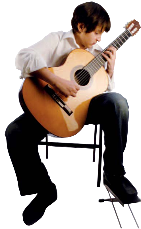
Affinché lo strumento sia piazzato all'altezza giusta, si solleva la gamba sinistra posando il piede su un poggiapiedi.

La mano destra passa sopra la cassa dello strumento, con l'avambraccio appoggiato sulla fascia. Ciò permette di tenere lo strumento e di avere un punto di appoggio affinché il polso e le dita possano muoversi liberamente. La mano resta sospesa, le dita toccano le corde solo per suonare.