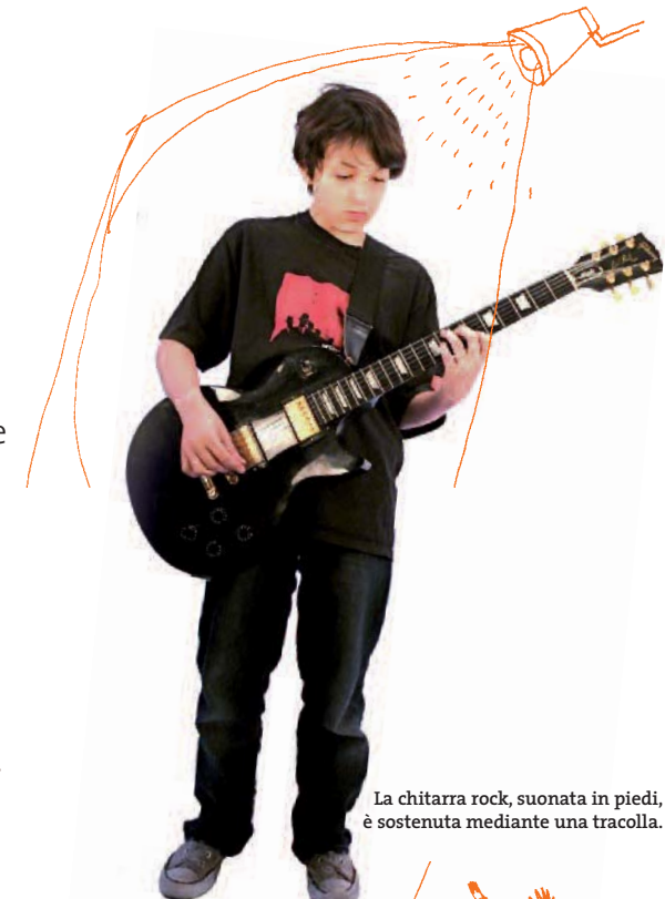
La chitarra rock, suonata in piedi, è sostenuta mediante una tracolla.