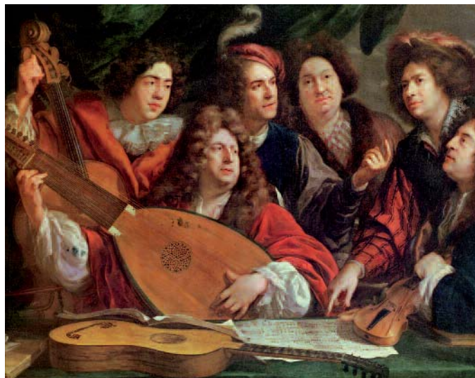
Robert de Ville, illustre musicista e "maestro di chitarra del re", ha scritto alcuni brani molto belli per chitarra, in particolare nel suo libro Livre de guitare dédié au Roi , del 1862.

È nel XVI secolo, con l'avvento della stampa musicale, che compaiono le prime raccolte di musica per chitarra. Adrain Le Roy, che è insieme suonatore di liuto e di chitarra, a partire dal 1551 pubblica numerose opere per chitarra. Esistono oltre duecento pezzi, di cui molti particolarmente belli. In Francia, anche re Luigi XIV suonava la chitarra e organizzava pure dei concerti privati!